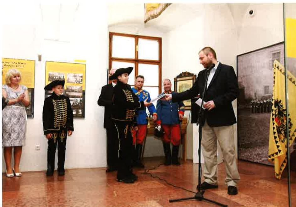
Ze slavnostního zahájení výstavy „Karel I. - poslední český král“.