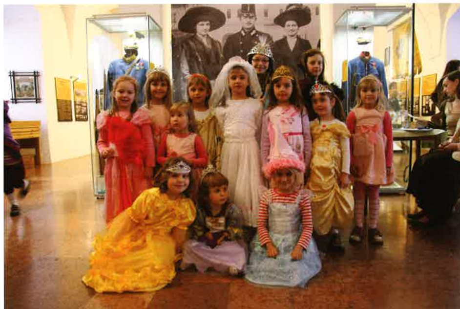
Vystrojené účastnice dětské soutěže „O nejkrásnější princeznu“ v rámci programu Muzejní noci 2012