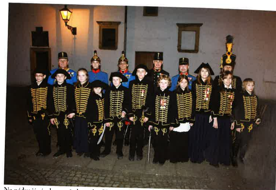
Na nádvoří zámku se představila i Husarská akademie 11. Szekelského husarského hraničářského jízdního pluku z Nového Jičína.