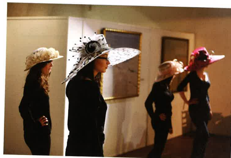
Historie a současnost na muzejní módní přehlídce.