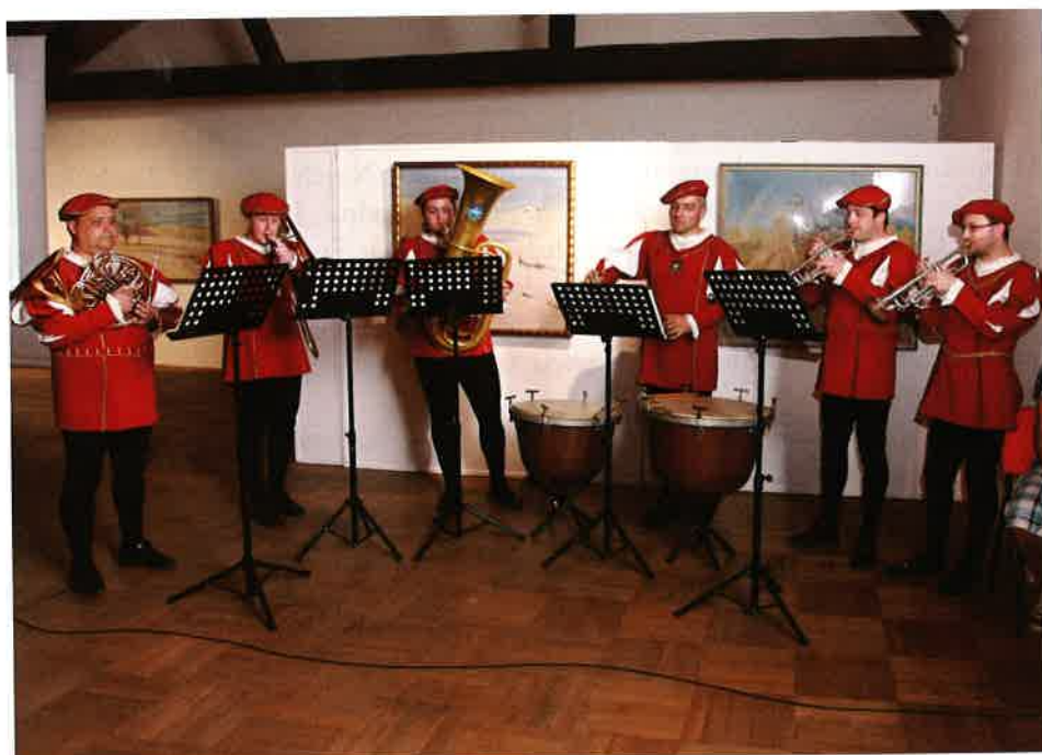
Trubači zámku Kunín.