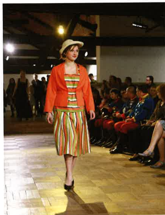
Historická móda z muzejních depozitářů na přehlídkovém molu