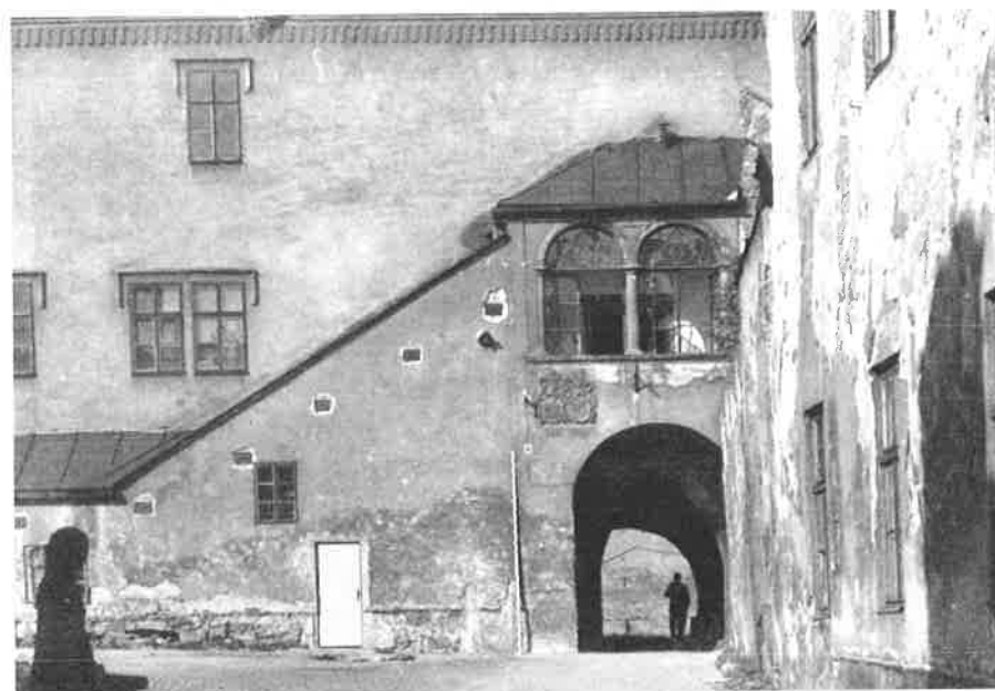
Zámecká lodžie v průběhu stavebních zásahů v šedesátých letech 20. století, kdy došlo ke stažení schodišlové části k hlavní zámecké budově pomocí ankrů.