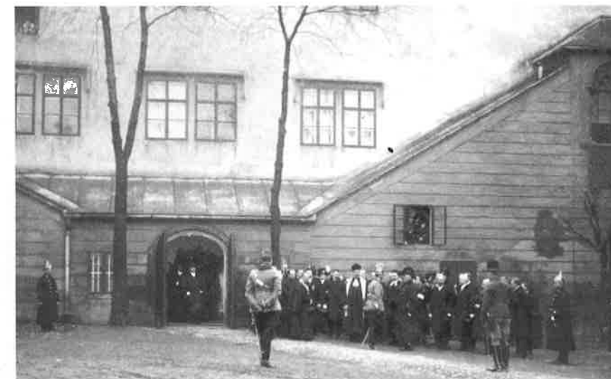
Návštěva Jeho Výsosti Karla Františka Josefa (1887 – 1922) a jeho manželky princezny Zity Bourbonsko-parmské (1892 – 1989) na zámku v Novém Jičíně 12. března roku 1912. Lodžie a přilehlé schodiště doposud zdobí pásová rustika a dominantní průčelí zdobí dva javory.