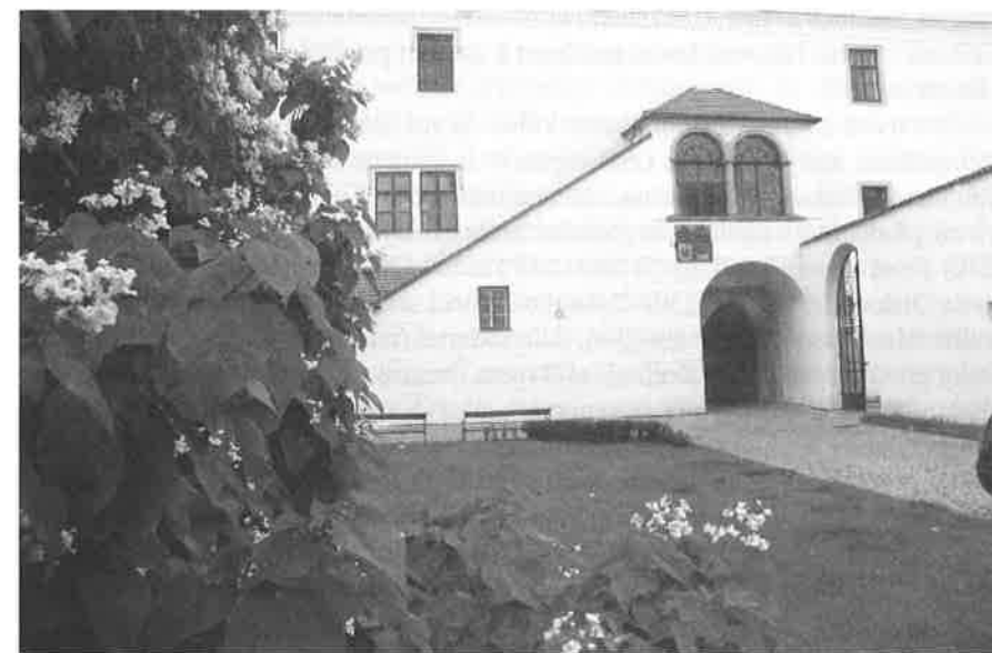
Provádění stavebních a restaurátorských prací na zámecké lodži bylo ukončeno v červnu roku 2004.