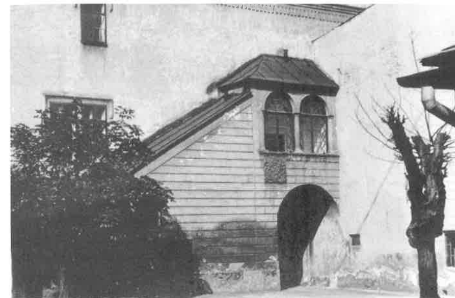
Nejstarší dochovaná fotografie prvního zámeckého nádvoří - kolem roku 1880, asi dvacet let po ukončení hlavní stavební činnosti tehdejšího majitele zámku, Tereziánské akademie z Vídeňského Nového Města.