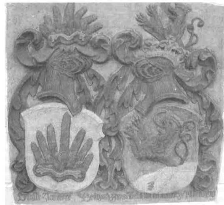
Detailní záběr na zrestaurovaný alianční znak Libuše z Lomnice a Bedřicha ze Žerotína. Foto: Radek Polách, 2004