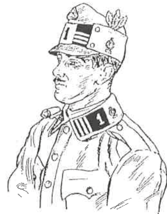
Obr. 2 Četař 1. příborského dobrovolnického praporu. Nakreslil B. Vlach

Rukopis upravila a přepsala: Irena Jašíková, MNJ