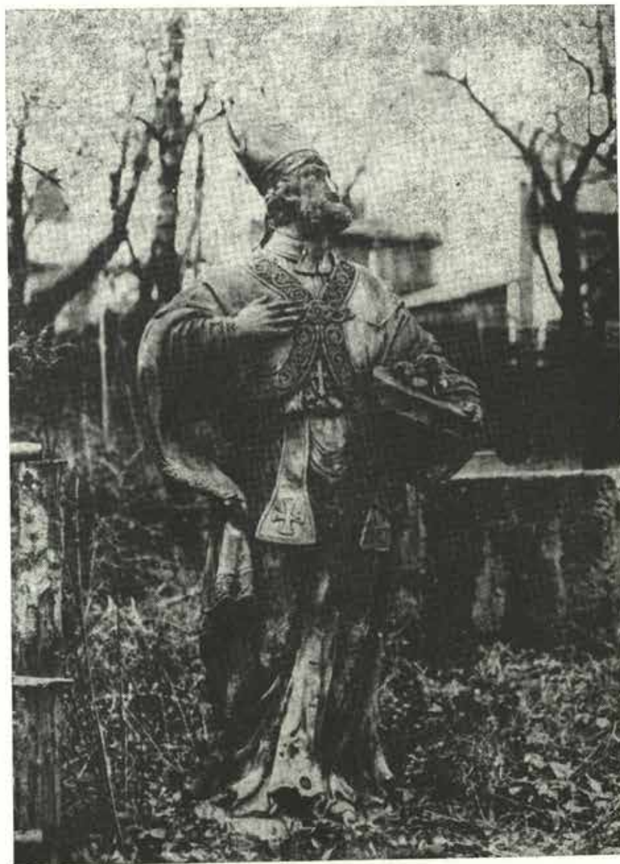
Socha svatého Mikuláše v zahradě sirotčince v Novém Jičíně

Starý městský farní kostel P. Marie, který měl jen tři oltáře, byl už v sedmdesátých letech 17. století v chatrném stavebním stavu. Byl malý a těsný a nestačil pojmut rostoucí počet obyvatel města. Jesuitský konvikt v Olomouci proto jako patron kostela naléhal na stavbu nového, velkého farního kostela a žádal od města a městských cechů, by přispěly finančně na novostavbu. Došlo k ní až v letech 1729–1734 resp. 1736, kdy po zboření starého kostela byla celá stavba dokončena. Podle dochovaného podrobného sumáře vydaných peněz bylo od 26. ledna 1729 do konce prosince 1734 zapláceno za stavbu nového kostela celkem 14 620 zl. Z toho řemeslníkům 10 304 zl., zbytek na stavební materiály. Zednickému mistru, jménem neuvedenému, který stavbu kostela provedl, bylo zapláceno podle kontraktu 4 700 zlatých. 10) Vnitřní práce na vybavení kostela 7 barokními oltáři, sochami, obrazy, kazatelnicí, lavicemi a dalším inventářem pokračovaly však pro nedostatek peněz ještě řadu let. Kostel byl konsekrován olomouckým biskupem až v červenci 1742.