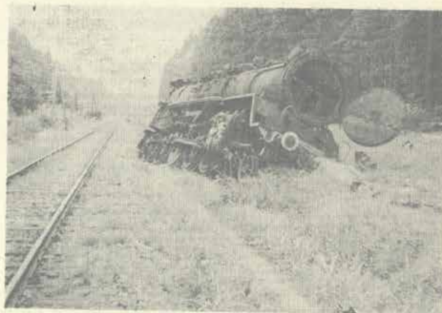
Výsledek diverzní akce z 3. 5. 1945 u Mořkova.

Úkryt v lese Stašku byl bohužel vyzrazen českým člověkem z Bordovic, a proto došlo k urychlenému opuštění působiště pro nebezpečí německé trestné výpravy a k přesunu do lesů k Zubří. Zde však byli štramberští partyzáni stále ohroženi přítomností německých vojenských jednotek a vznikly jim vážné potíže v zásobování. Z těchto důvodů je rozhodnuto přejít do úkrytu ve městě Příboře, do továrny na kachle v místní části v Klokočově. Tento úkryt byl vyzrazen opět