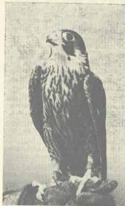
Sokol stěhovavý Foto Ivo Otáhal 1980