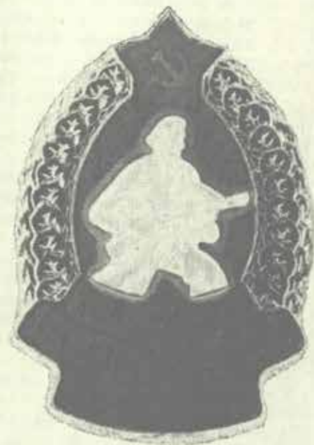
Poválečný odznak štramberských partyzánů.

Kronika Štramberští partyzáni 1942 – 1945 , uloženo na OV SPB Nový Jičín.