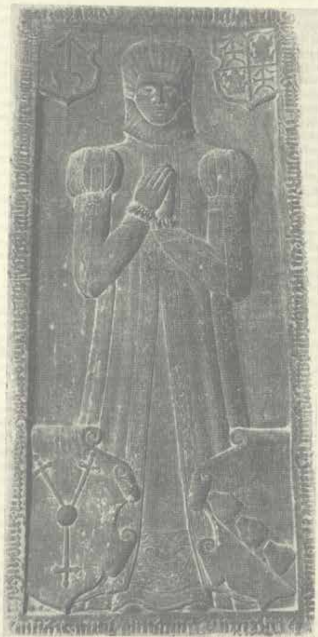
Náhrobní deska Johanky z Limberka Foto Miloš Lossmann 1979