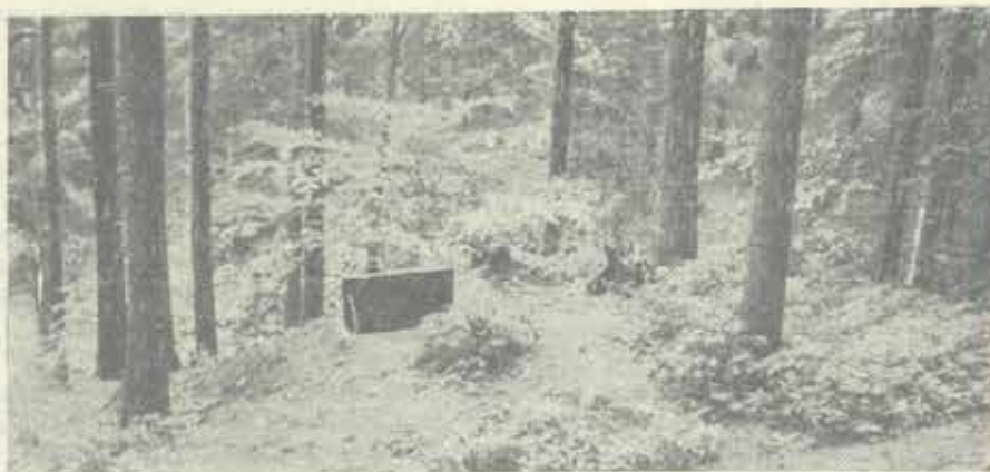
Vchod do partyzánského bunkru v zuberských lesích.