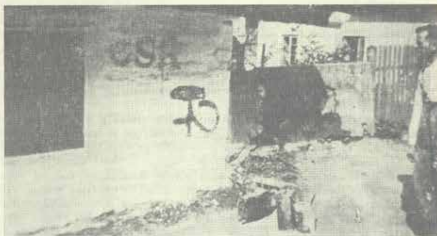
Obecní sluha ve Štramberku odstraňuje nápisy napsané komsomolci na počest vítězství Rudé armády (září 1942)

várně, strojních náček, zcizení součástek z barevných kovů, sypání písku do náprav vagónů a strojů v Tatrovce, zničení odpalovacího stroju v štramberském lomu na vápenec, elektromotoru, elektrických kabelů a mazacího oleje. O sabotážích této skupiny se s uznáním zmiňuje v dubnu 1942 (tedy ještě před vytvořením pevné organizace) ilegální číslo časopisu moravského vedení KSČ Hlasý podzemí. Od 2. poloviny roku 1942 se dostalo do popředí aktivní příprava k boji. Začalo se s budováním partyzánské zemljanky nejprve u nádraží, potom pod