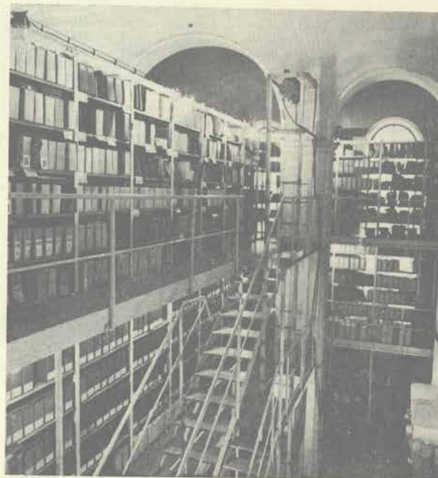
Depozitář okresního archívu Nový Jičín 1979