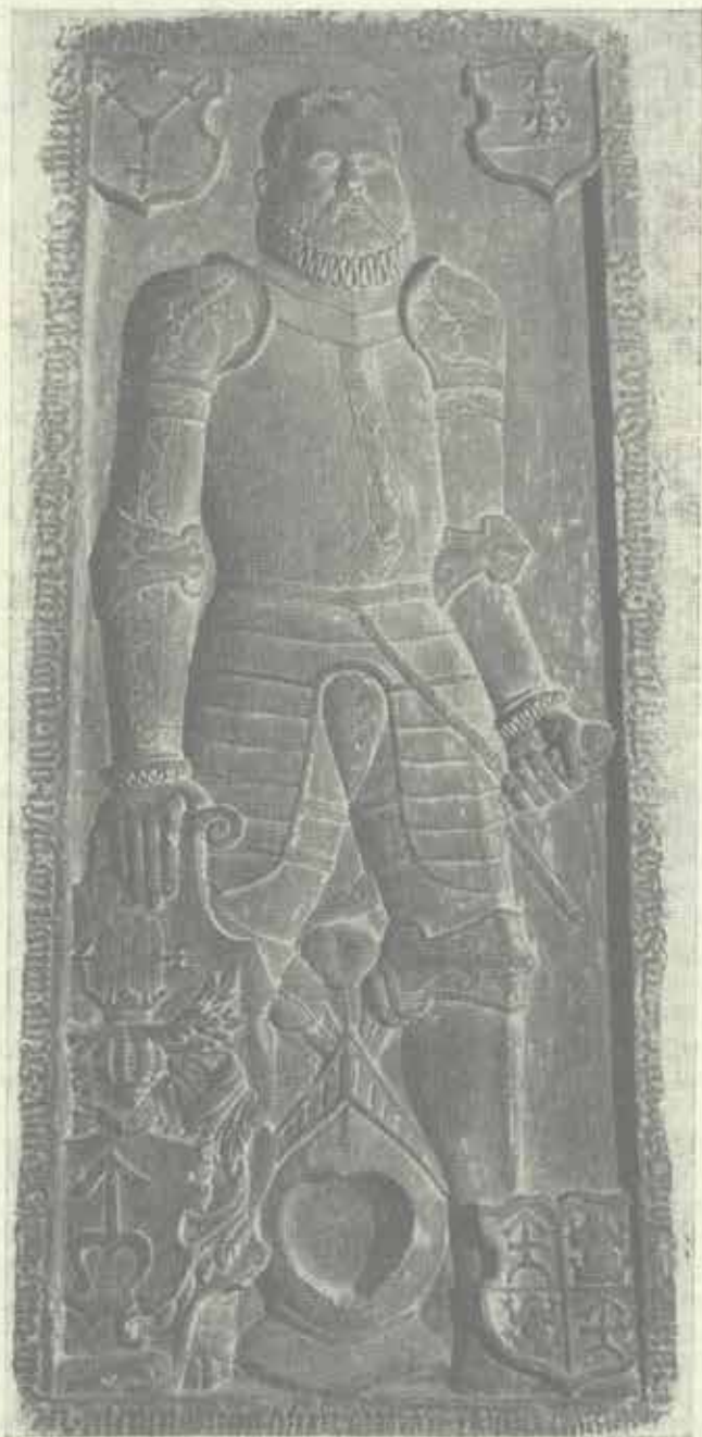
Náhrobní deska Jana Sedlnického z Choltic 1979