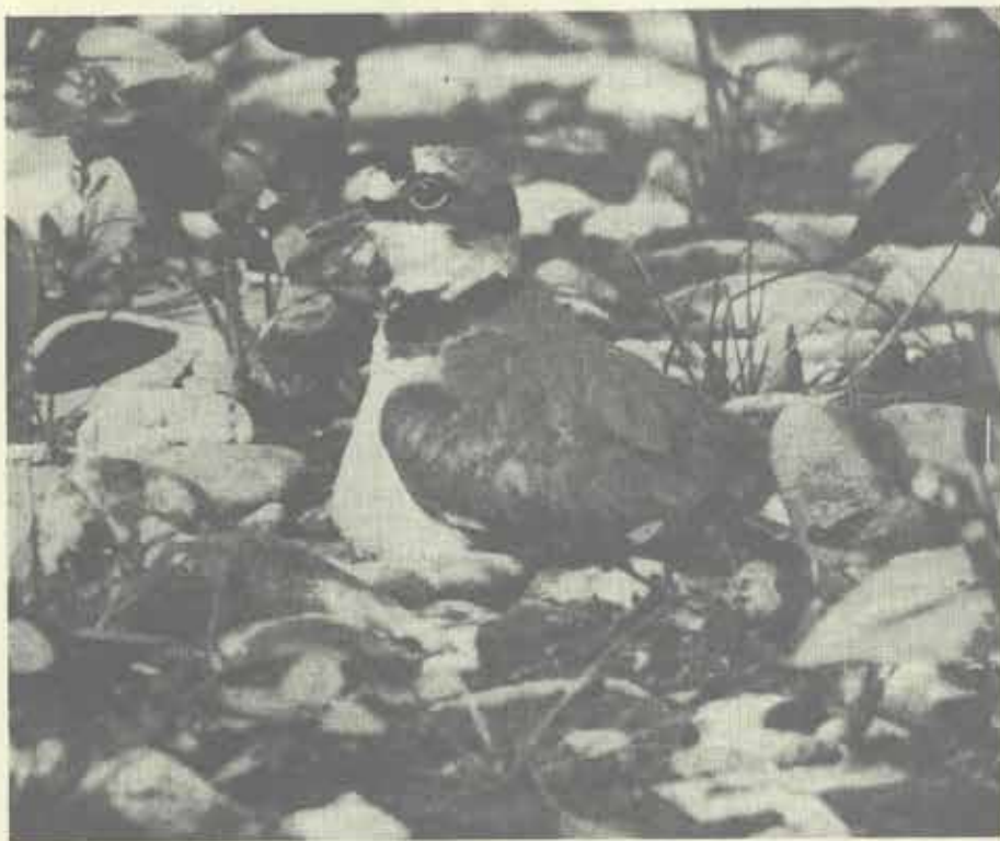
Kulík říční — Charadrius dubius Scop., 1786

Kulík říční je velikostí srovnatelný s polním. Jako všichni kulíci má velkou hlavu s poměrně vysokým čelem. Velké oči jsou lemovány asi 1 mm širokým světle žlutým kruhem. Od kořene zobáku, který je krátký, rovný a černě zbarvený, se přes oko táhne černý pásek. Krk, hrdlo a brada jsou zbarveny smetanově bíle a na volati je černý pásek. Svrchu je kulík říční písčité šedohnědý, břicho má bílé.