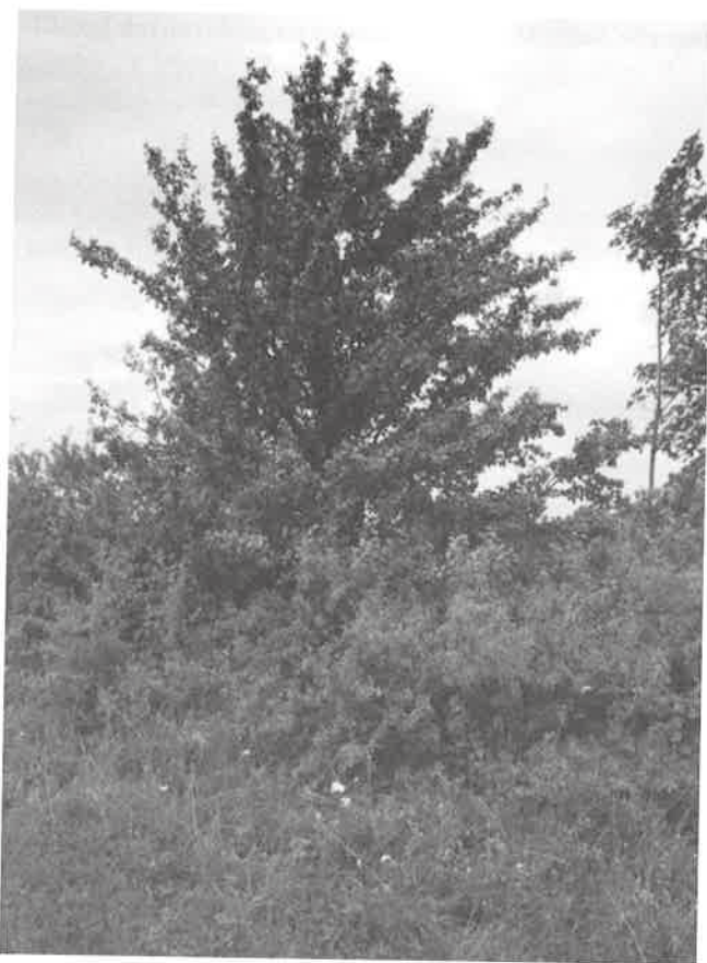
Stanoviště hořce křížatého na hřebenu PR Svinec, lem křovin, foto P. Mičková, 2009.