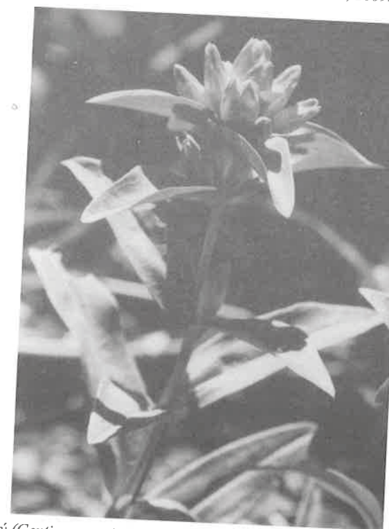
Hořec křížatý ( Gentiana cruciata ), meze pod křížem PR Svinec, foto R. Jarnot, 1999.