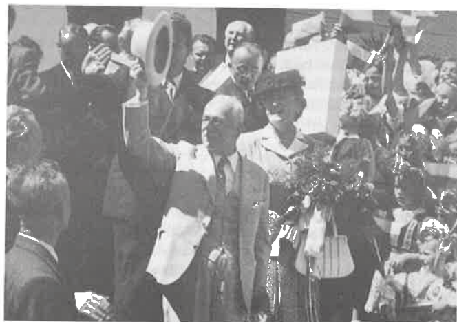
Edvard Beneš s manželkou Hanou na novojičínském náměstí.