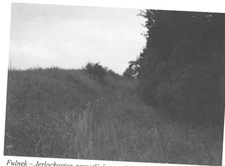
Fulnek – Jerlochovice, zarostlý úvoz polní cesty, foto P. Mičková 2009.

Poznámky k dokumentaci hořce křížatého ( Gentiana cruciata ) na Novojičínsku