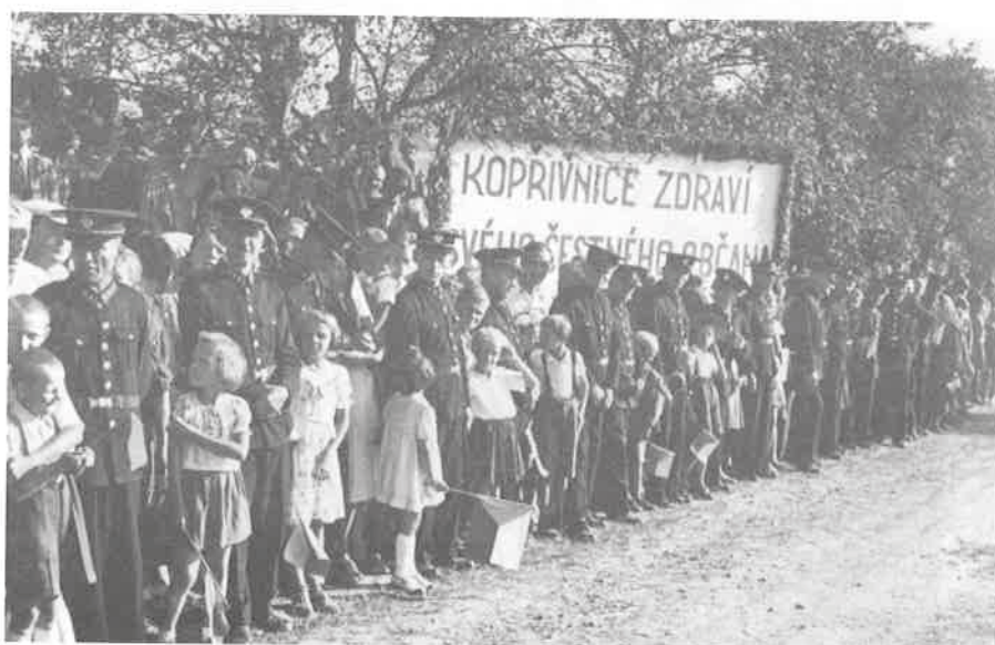
Kopřivničané očekávají příjezd Edvarda Beneše na okresní silnici pod Kazničovem.