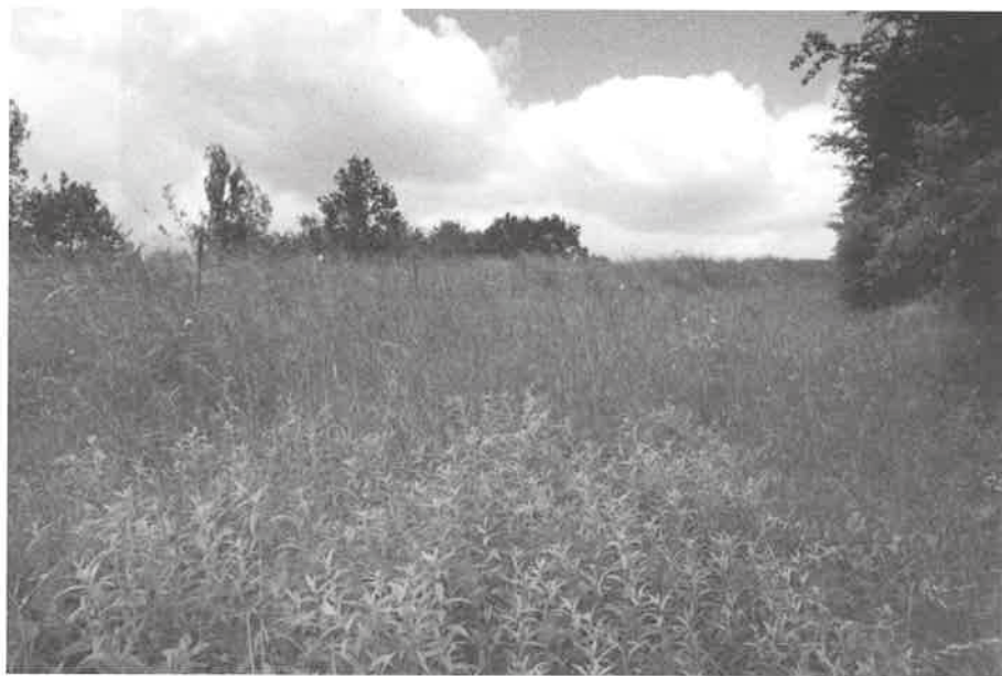
Fulnek – Jerlochovice, spodní část stanoviště úvozu, sterilní populace omanu vrbolistého ( Inula salicina subsp. salicina ), foto P. Mičková, 2010.