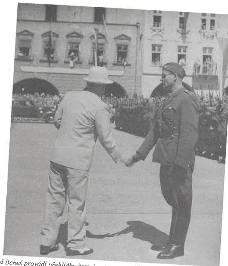
Edvard Beneš provádí přehlídku čestné roty na novojičínském náměstí. SOKA Nový Jičín.