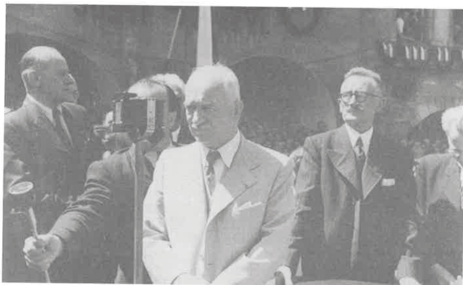
Edvard Beneš v Přiboře.