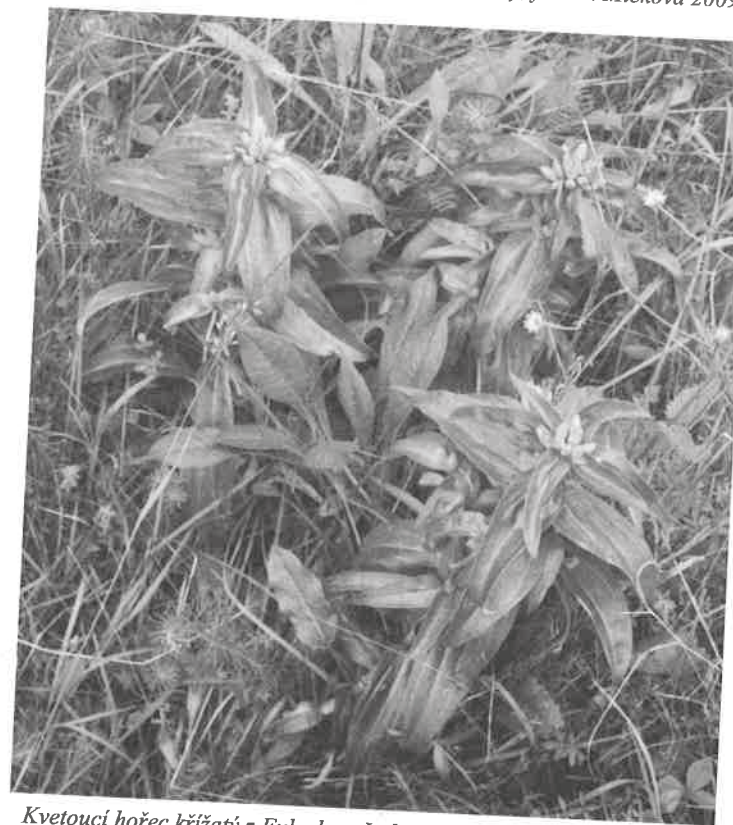
Kvetoucí hořec křížatý z Fulneku - Jerlochovic, foto P. Mičková, 2009.