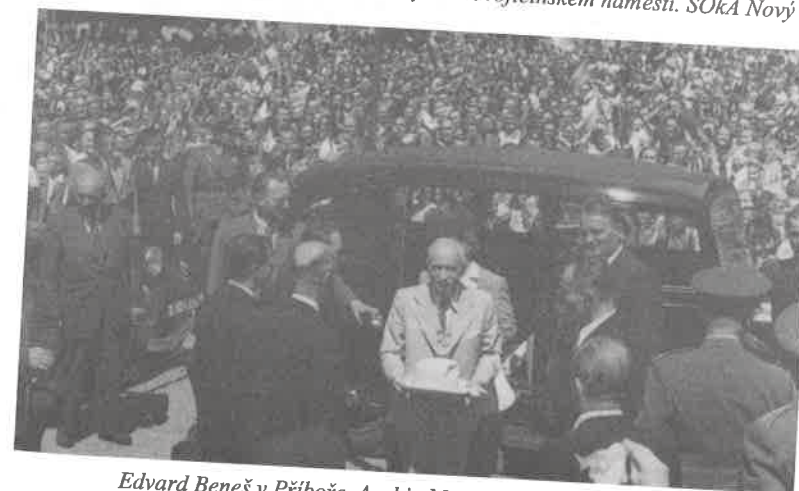
Edvard Beneš v Příboře.