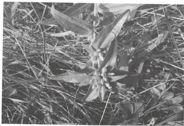
Kvetoucí rostlina hořce křížatého v lemu křovin, PR Svinec, foto P. Mičková, 2010.

Poznámky k dokumentaci hořce křížatého ( Gentiana cruciata ) na Novojičínsku