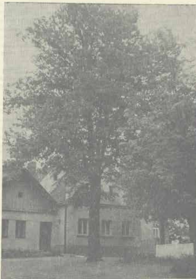
Lípa svobody, Starý Jičín - náměstí Foto Eva Lukášová 1980

Zajímavým stromem vyhlášeným jako chráněný přírodní výtvar je „Kunínský jilm“ – jilm vaz ( Ulmus laevis Pall.), rostoucí v kunínském parku u zámku. Má krásný rovný kmen a je jedním z nejvyšších stromů v okrese. Jeho výška se odhaduje na třicet pět metrů.