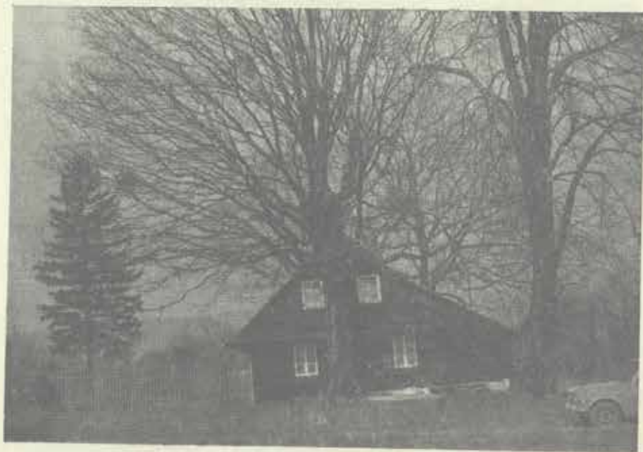
Klen Na kopané u Frenštátu  1980