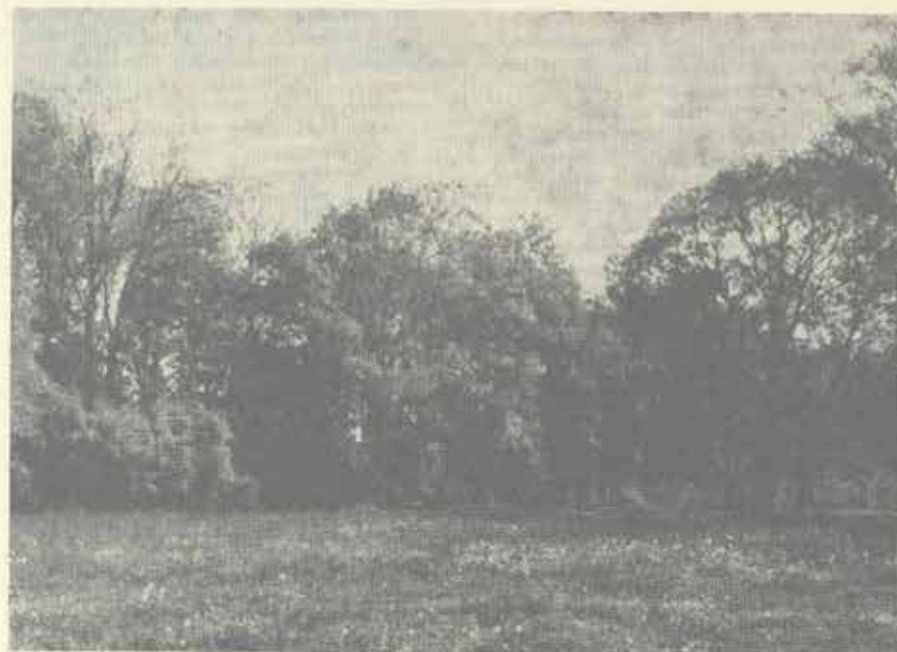
Biotop slavíka tmavého Foto Jiří Hudeček 1980

Polanka n. O., a. Ostrava, porosty vrby u Odry. Zde zpíval 1 sa-