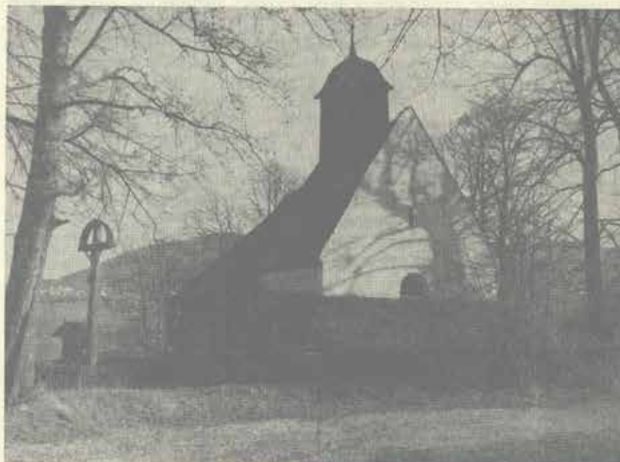
Kostel sv. Kateřiny v Tamovicích, v pozadí Závěšice