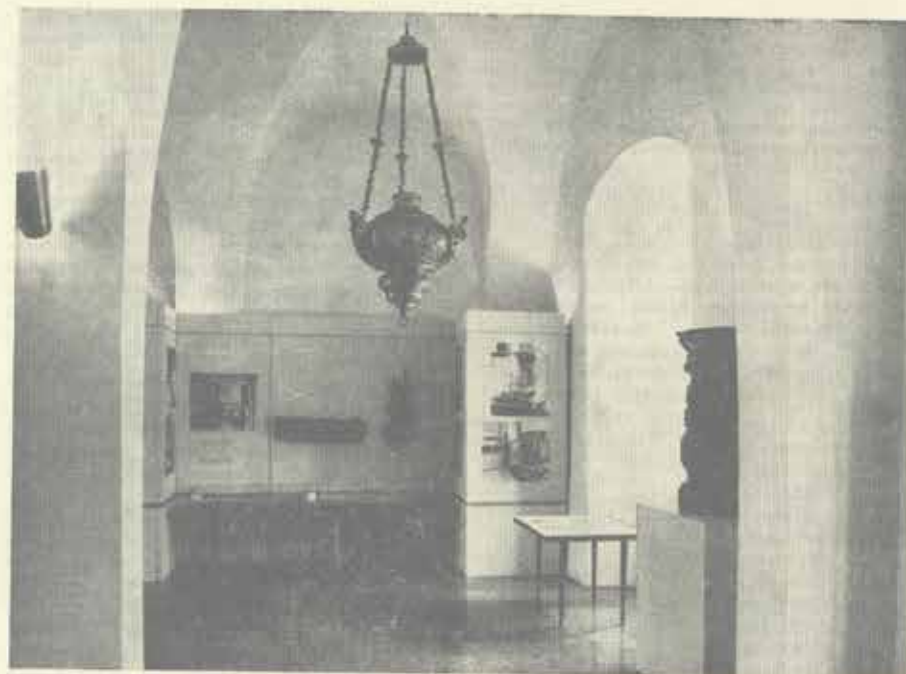
Z výstavy konzervátorských prací 1981

Krok z anonymity, tak nějak se dá charakterizovat výstava, která byla zahájena 5. února 1981 v Okresním vlastivědném muzeu v Novém Jičíně.