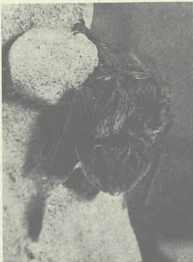
Netopýr černý

prostory, které by sloužily jako větší zimoviště netopýrů. Na zimovištích lze totiž relativně nejsnadněji zjistit základní faunistická data u celé řady druhů netopýrů, kteří jinak žijí velmi skrytým způsobem života. Proto také souhrn dosavadních literárních údajů o netopýrech novojičínského okresu je stručný. Nejstarší literární údaj pochází od Remeše (1927), který uvádí výskyt vrápence malého, netopýra ušatého a netopýra velkého z Frenštátska. Další několik údajů najdeme v pracích Beneše (1974, 1980). Hanák a Gaisler (1976) uvádějí nálezy velmi vzácného netopýra parkového a posledním literárním údajem jsou dva nálezy netopýra velkouchého z Fulneku a Veřovic (Beneš - Daněk, 1978).