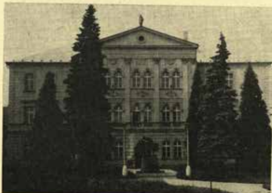
Budova bývalé chlapčeské měšťanské školy ve Frenštátě p. R.

Tisíce žáků prošlo branou školy a mnozí z nich se přičinili o rozkvet naší vlasti nejen doma, ale i za hranicemi.