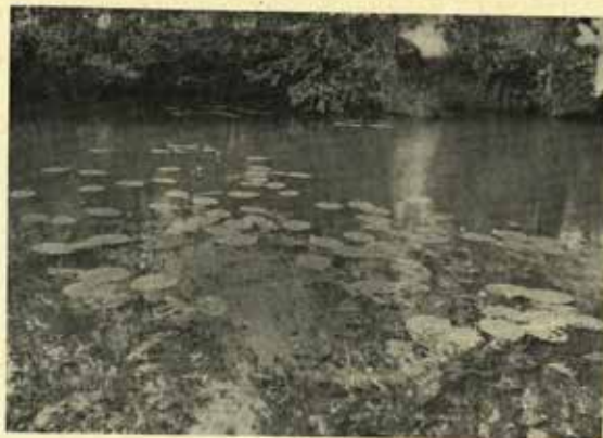
Nenarušené přírodní prostředí