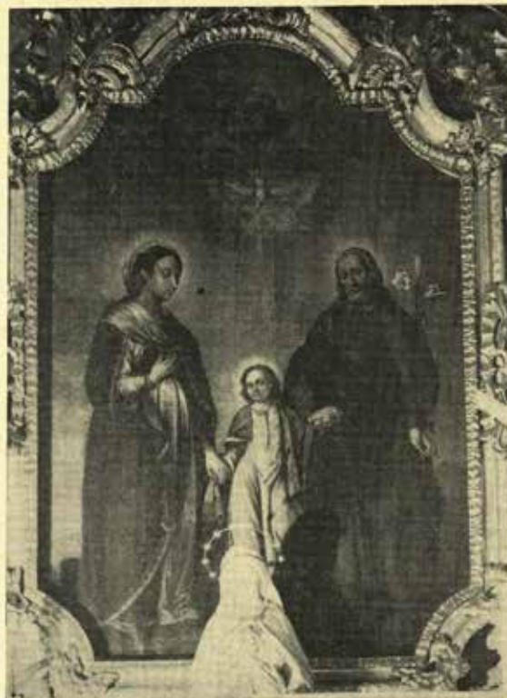
Delongův altární obraz v Příboře z r. 1669

Delong byl nepochybně dobrý malíř závěsných obrazů kostelních v pozdně renesančním stylu. O jeho pracích víme zatím jen málo. Z roku 1665 pochází malířská výzdoba oltáře kostela sv. Petra a Pavla v Lichnově u Frenštátu p. R., podnes dochovaného, který vytvořil spolu s opavským stolařem a řezbářem Loren-