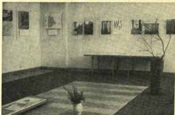
Záběr z výstavy Chráněné rostliny Beskyd

stanovila vyhláška č. 54/1958 Sb. pro území ČSR jako druhy ohrožené a vzácné se vyskytující.