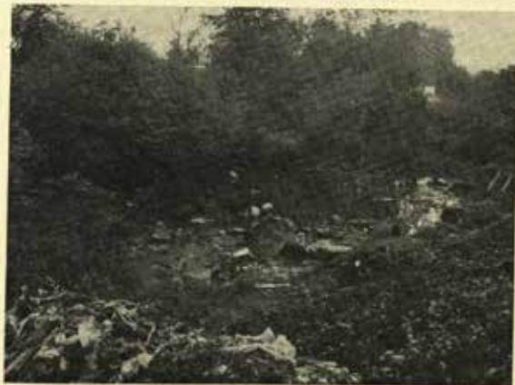
Přírodní prostředí esteticky znehodnocené skládkou