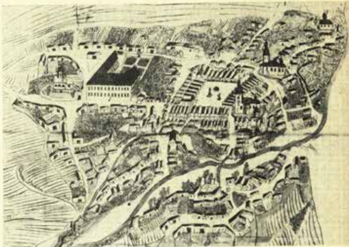
Pohled na město Příbor z r. 1728 Kresba Karla Ludvíka Chrámkem

země městem na stavbu koleje proti pustému kostelíku sv. Valentina, byla výchova nové mládeže v plně katolickém duchu z řad drobné šlechty a měšťanstva na severovýchodní Moravě, na samém okraji alpné luterských oblastí těšínského Slezska a Valašska. Stavba rozlehlé koleje o 2 podlažích s 2 bočními křídly, s hlavní frontou ke kostelu sv. Valentina, převzatého řádem, započata r. 1694 trvala několik let, protože stavební materiály a zemesníci byli po brzké smrti fundátora zajišťování správu hruvaldského panství dosti šknové. 13) Na její vnitřní vyzdobě po r. 1700 a úpravách kostela sv. Valentina pro účely koleje byla dána příležitost k uměleckému uplatnění příbořským malířům, zejména při pozdějším rozšíření a přestavbě kostela sv. Valentina. Jak pionistické koleje o řádový kostel sv. Valentina v té době (před přestavbou) vypadaly, podává nám dosud neznámý pohled na město Příbor z r. 1728, nakreslený městským syndikem příbořským Karlem Ludvíkem Chrámkem. Převýšený situační plán a jeho okolí pořídil na žádost magistrátu pro brněnského historika Dismae Josefa Ignáce rytíře Hofera, který připravoval se sňatkem moravských stavů k vydání mapy Moravy. 14) Plán města zachycuje nám schematicky, avšak věrně podobu celého města, jednotlivých jeho domů, zejména stavební vzhled jeho kostelů a význačnej-