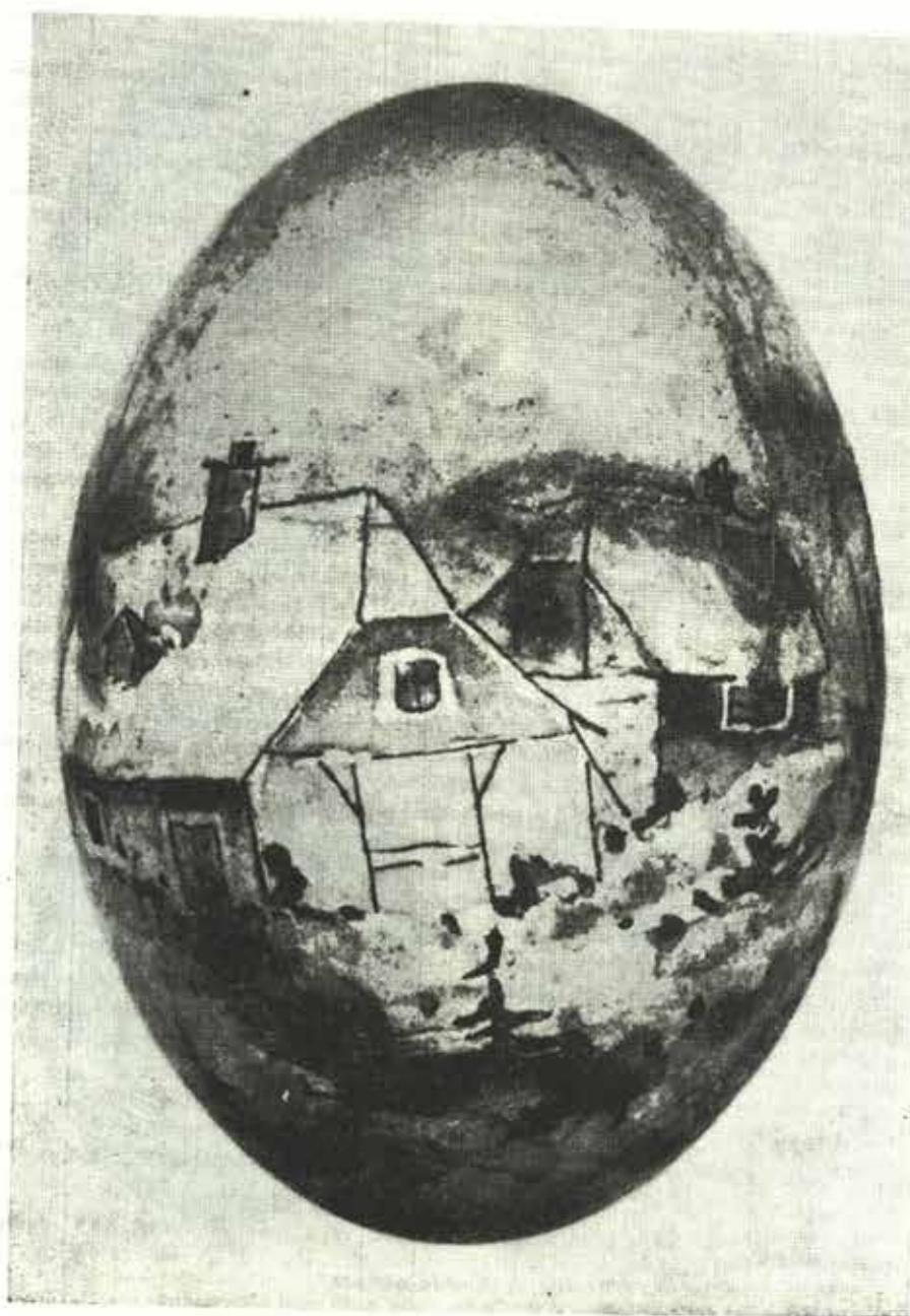
Pozitivní malba lihovými barvami na příborské kraslici N - 1406

Dvě kraslice příborské sbírky jsou zdobené pozitivním malováním, avšak zatím zůstávají nelokalizované a nedatované: N-1414 má přirozený bílý podklad s barevným olejovým provedením motivu Agnus Dei na poukle. N-1406 rovněž zachovává bílý podklad. Lihovými barvami realizovanou malbu dvou hrázděných domků tvořících jedinou výzdobu zvýrazňují kontury černou tuší.