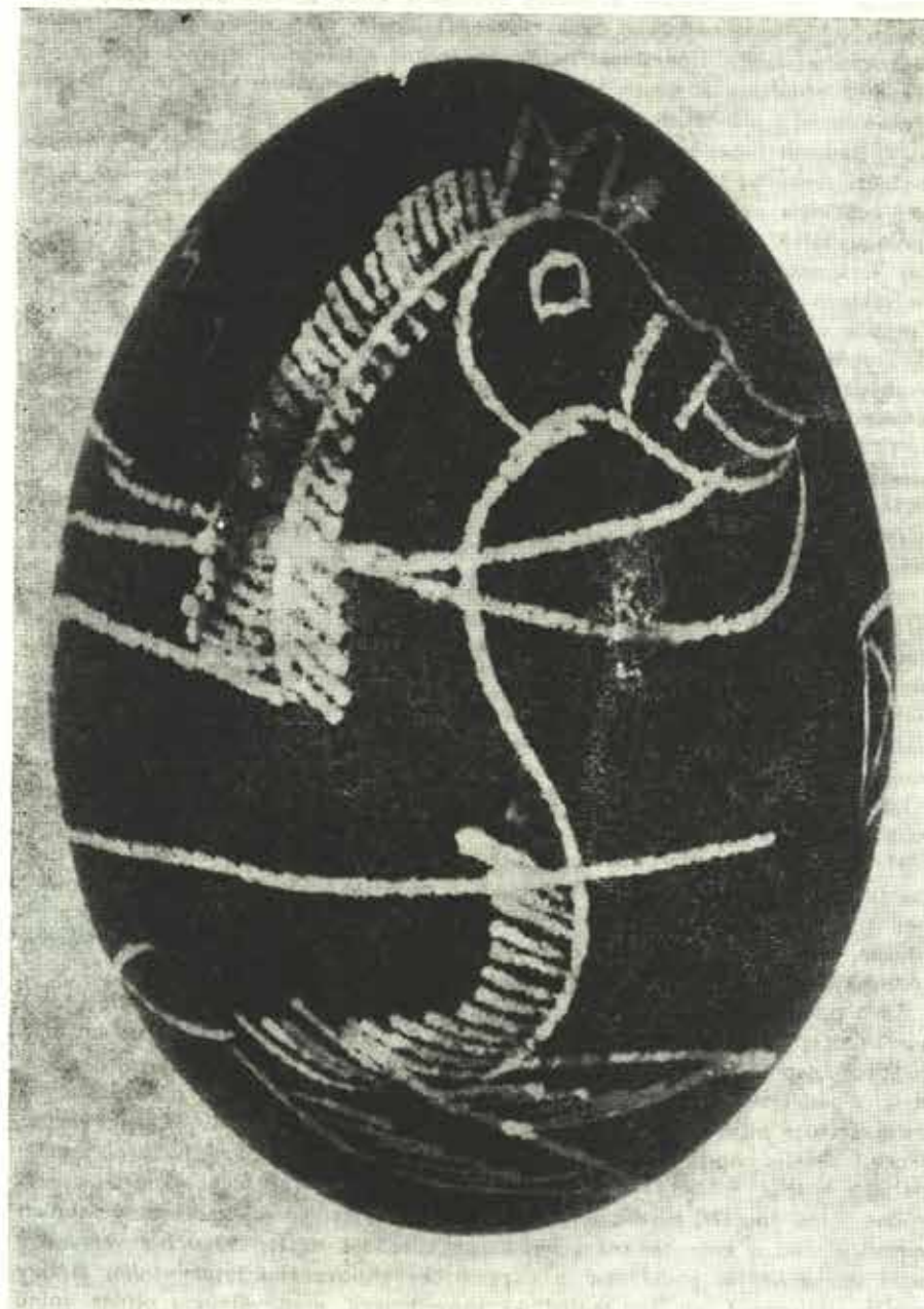
Část svatebního motivu na gravírované kraslici N. 1475 z Příbora

Místní typ je zastoupen dříve zmíněnými lichnovskými kraslicemi s datací 1895 na dvou z nich. Několik dalších kraslic patří ornamentálně k sobě. Mají fialový nebo vínově červený podklad a podélně umístěné stylizované motivy dvou větviček s listy a úponkem tak, že úponky směřují vždy ke koncům vejce. Zbýlý prostor podélně vyplňují verše. 2) Následující kraslice zřejmě místní proveniencí jsou s cihlově červeným a fialovým podkladem asymetricky členěné, nepravidelně