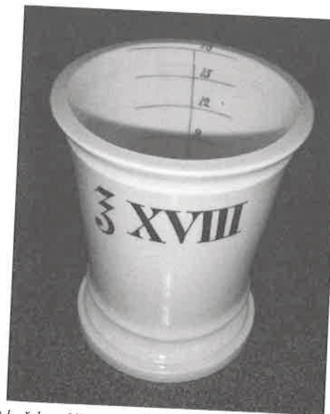
Odměrka z lékárny U Černého orla v Novém Jičíně.