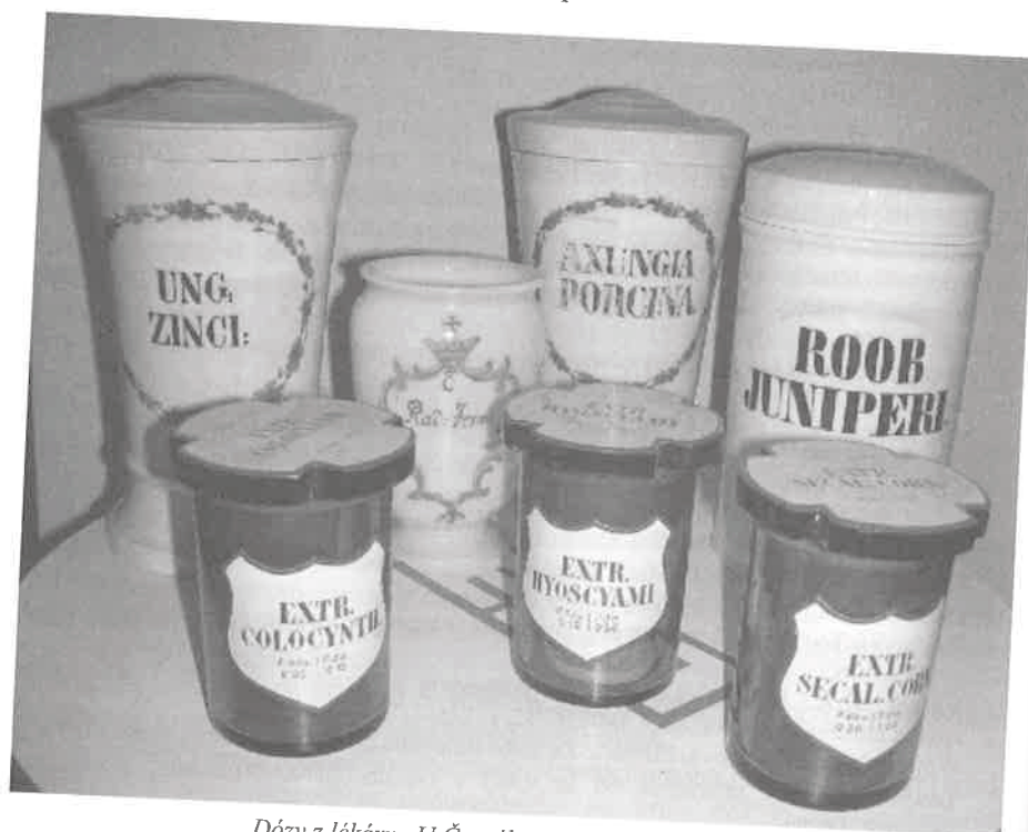
Dózy z lékárny U Černého orla v Novém Jičíně.