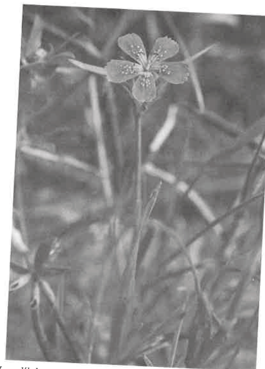
Hvozdík kropenatý označovaný jako slzičky Panny Marie.