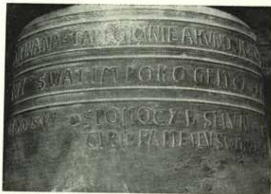
Detail nápisu na zvonu z roku 1579 ve Starém Jičíně.

dvouřádkový nápis kapitálově dělený rozetami: S POMOCY B SLIVAL + / GIRIK PAMFILVS W MEZRIC + a dva polské štíty s monogramy. Vlevo erb Karla ze Zerotína se lvem v poli a s monogramem + KZZ +, vpravo erb jeho druhé manželky Johanky Cermické z Kácova s dvěma překříženými meči v poli a s monogramem YC / ZK. Výzdoba protilehlé strany krku tvoří špatně čitelný jednářádkový nápis kapitálově: TOHO CZASV K SYME PROVSKE 1) (?) a pod ním 4,5 cm vysoký monogram ve třech řádcích nad sebou S/B/M/P. Na přechodu k věnci obíhá jedna plastická linka. Věнец členěný jednou plastickou linkou zesiluje na okraji plochý líst. Výška písma na čepci 3,2 cm, na krku 2 až 3 cm. 2)