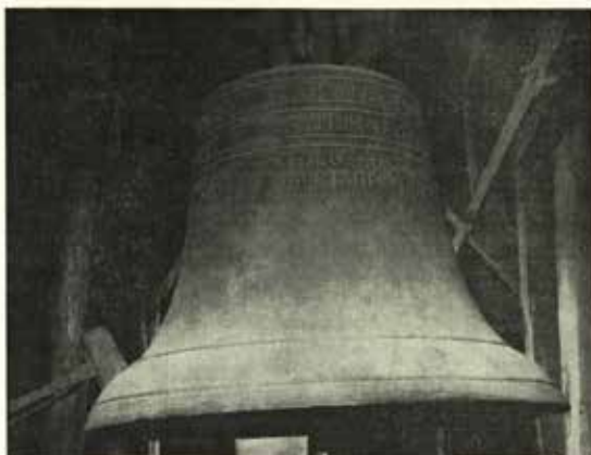
Zvon z roku 1579 ve farním kostele sv. Václava ve Starém Jičíně