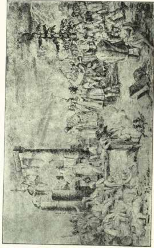
Jan Knebl: Kráľové Mojmir pred Ľzeccm Svätomirjem pri slávnosti korunovania na Radhošti, kresba tuškov, 1900