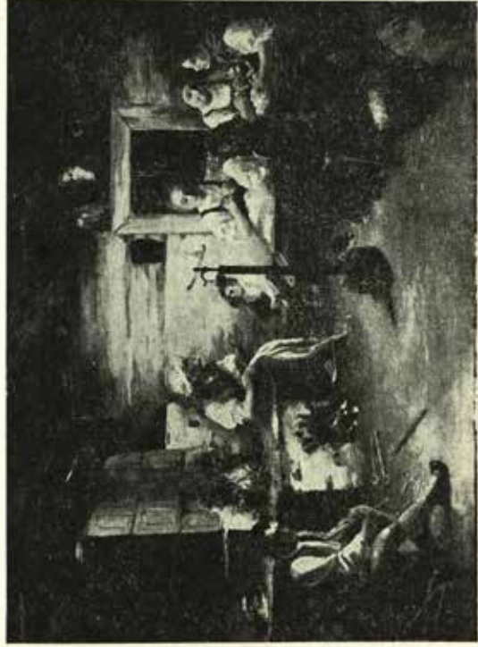
Jan Knebl: Draní priji no Valaškov, olej, 1903