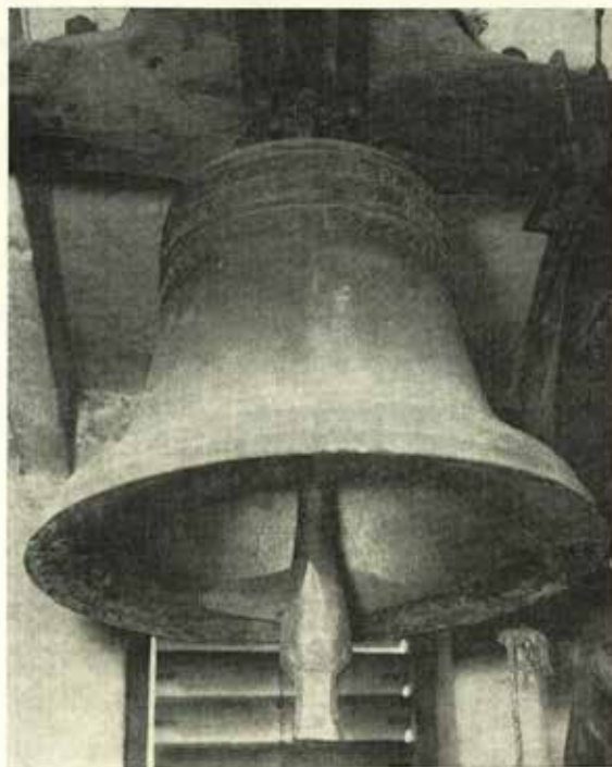
Zvon z roku 1562 v kostele sv. Kateřiny v Trnávce

Bohatou plastickou výzdobu, kovoličsky však mnohem méně náročnou, užíval i Solníkův nástupce Jiří Pamfilus. Jeho díla je však na území Severomoravského kraje prozatím význačně zastoupeno pouze jediným zjištěným zvonom z roku 1579, ulitým do farního kostela sv. Václava na Starém Jičíně. Mimo tradičního dvořádkového nápisu kapitálou děleného rozetami, který obíhá na čepci, je k výzdobě zvonu pa-